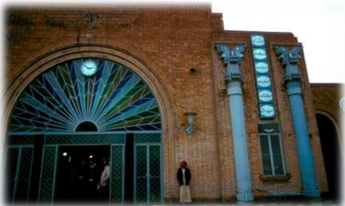
Ahvaz railroad station